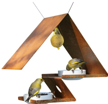
Artikelbezeichnung: VHT-4-H / VHT-4-RH Vogelfutterhaus Artikelnummer: 1113-H / 1125-RH